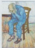
Вінсент Ван Гог «На порозі вічності»